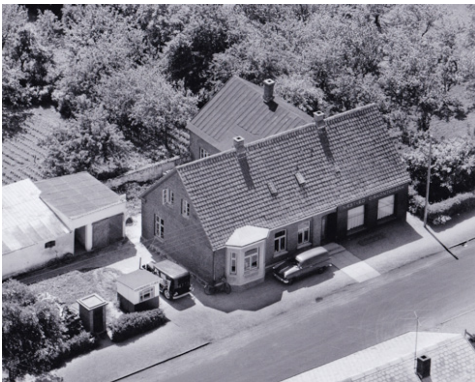
Bygaden 25 i 1950'erne, et hus fuld af liv og mennesker