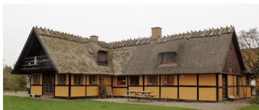
Hjortevangsgård, Svinøvej 76