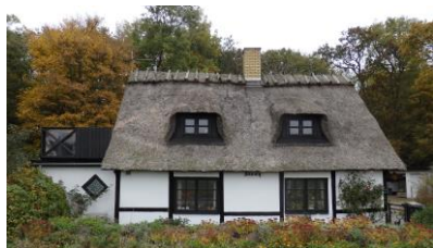
Skovly, Dybsøvej 28